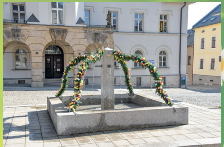
Auch der traditionelle Osterbrunnen sprudelt wieder.