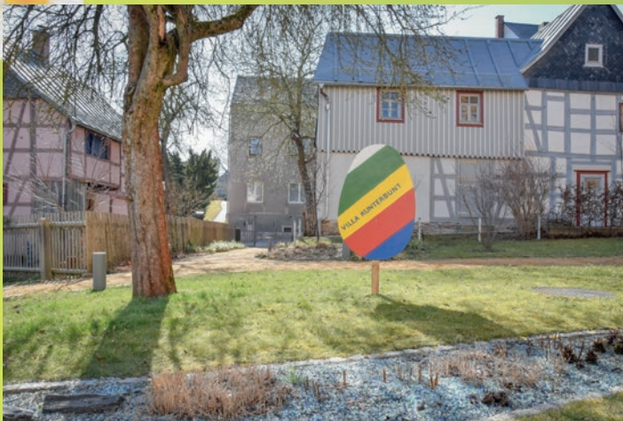
Überall wurden wieder riesige Ostereier verteilt, die von unseren Kitakindern bemalt wurden.