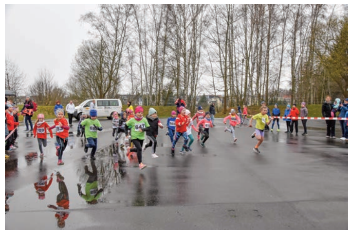
Auch die Kleinsten hatten trotz des schlechten Wetters großen Spaß.