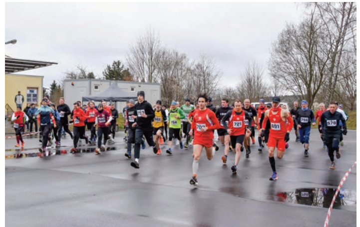
Start der 5 km- und 9,5 km-Läuferinnen und Läufer.

Wir freuen uns bereits auf die nächsten spannenden Wettkämpfe und bedanken uns bei allen Beteiligten für ihr Engagement und ihre Leidenschaft für den Laufsport.