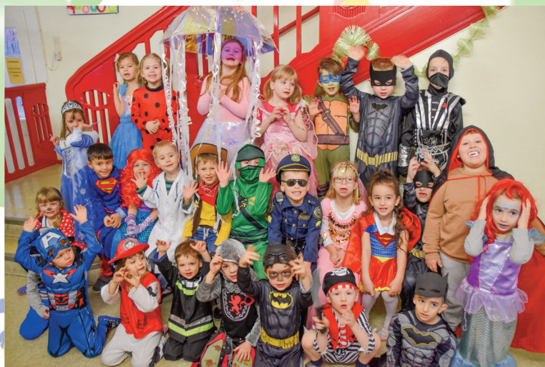
Kindertagesstätte „Villa Kunterbunt“, Treuen