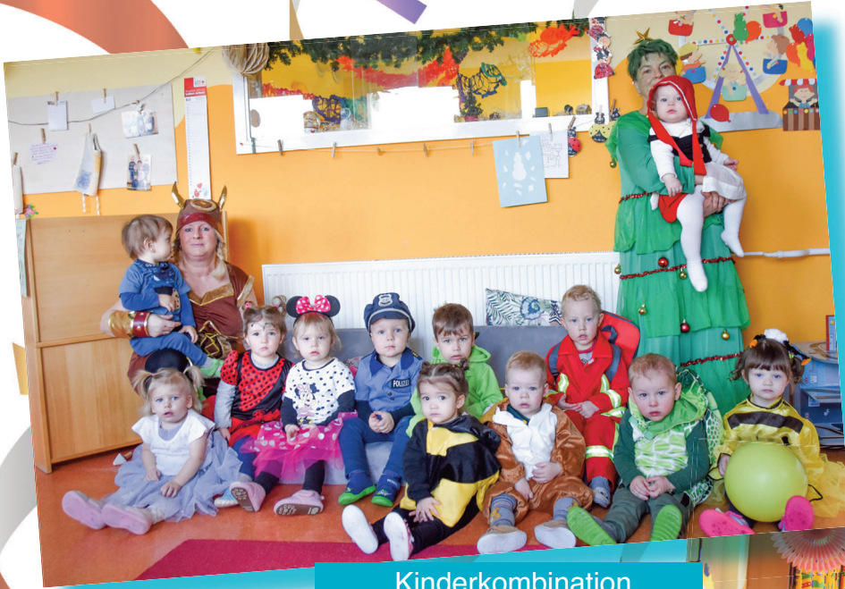
Kinderkombination „Nesthäkchen“, Treuen