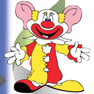
Kindertagesstätte „Kleine Strolche“, Eich