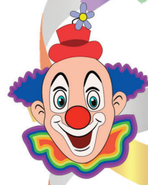
Kindertagesstätte „Pfiffikus“, Schreiersgrün