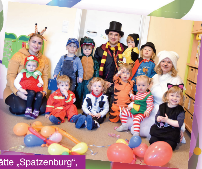
Kindertagesstätte „Spatzenburg“, Hartmannsgrün