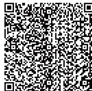
QR-Code zum Ihrem Termin

Alternativ steht auch weiterhin die telefonische Terminvereinbarung unter (037468) 638-34 zur Verfügung. Wir bitten, gerne vorrangig, unser neues Online-Buchungssystem zu nutzen!