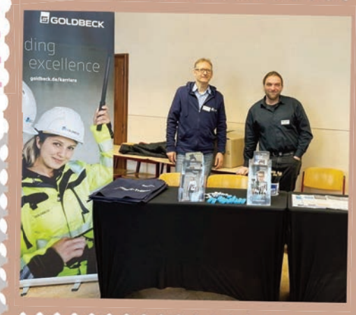
Text: E.-M. Puschner, Praxisberaterin