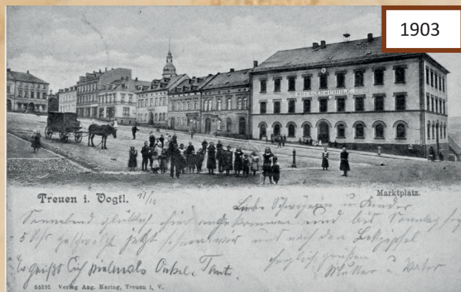
Eine Postkarte, welche den Marktplatz im Jahre 1903 zeigt, ein Jahr vor Einweihung der Lessing-Schule.