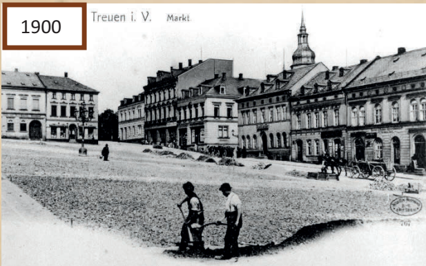
Ein Bild von 1900, welches Zwei Arbeiter zeigt, die den Marktplatz mit Schutt ebneten.

Jedoch ließ das nächste Feuer nicht lange auf sich warten. Bereits im Jahre 1846 entfachte der nächste verheerende Brand. Nach einer regelrechten Brandserie in Treuen, war Dank der verbesserten Strukturen und der modernisierten Ausrüstung der Feuerwehr das Brandrisiko stark gesunken und Treuen konnte sich von den finanziellen Schäden erholen.