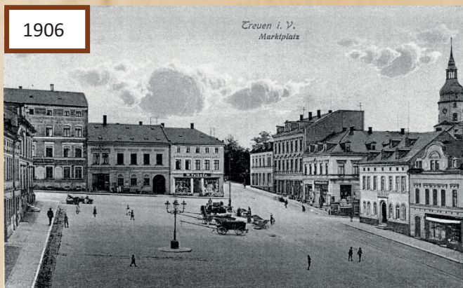
Eine Laterne schmückt nun den Marktplatz und beleuchtet ihn in dunkel Zeiten.