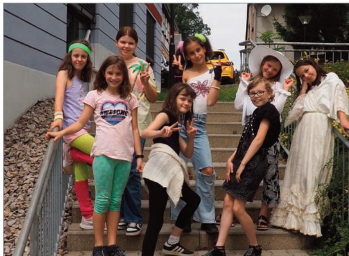
Die Schulreporter der Lessing-Grundschule Treuen verabschieden sich von Ihrer Grundschule, hier am vorletzten Schultag in der Mottowoche „Zeitreise in verschiedene Jahrzehnte“.