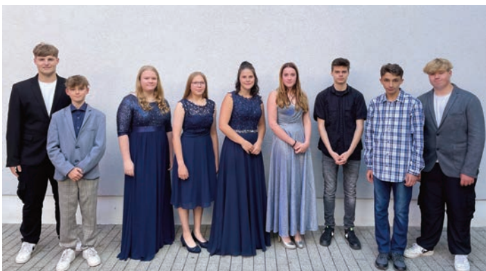
Die Hauptschulgruppe Klasse 9 – 4 Schüler erreichten den Qualifizierenden Hauptschulabschluss, 6 Schüler ihren Hauptschulabschluss