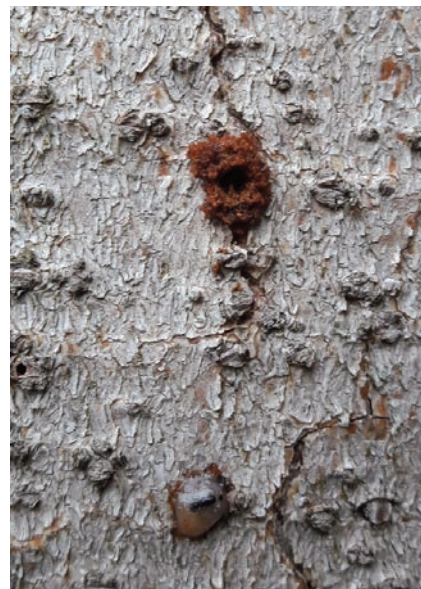
Einbohrloch mit Bohrmehl.

Rinde erkannt werden. Diese Bäume sind unverzüglich aufzuarbeiten, die Rinde unschädlich zu machen oder aus dem Wald zu verbringen. Die Verfügbarkeit forstlicher Unternehmer ist aktuell sehr angespannt. Es empfiehlt sich also dringend, sofort nach dem Erkennen befallenen Holzes Forstunternehmer zu kontaktieren. Die Revierleiter nennen bei Bedarf Forstunternehmer aus der Region.