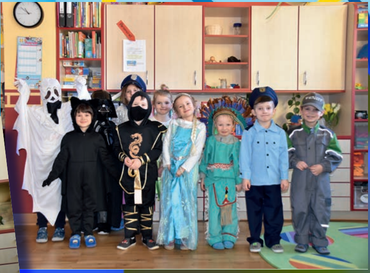
Kindertagesstätte „Kleine Strolche“, Eich