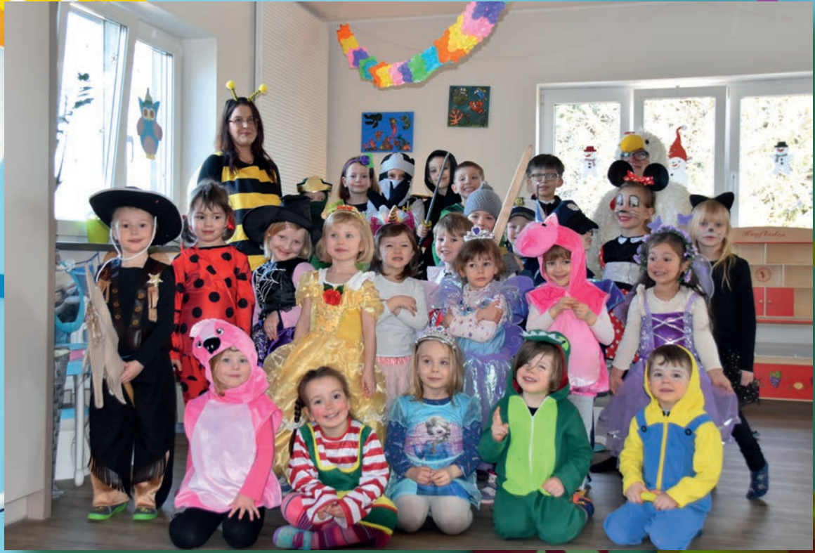
Kindertagesstätte „Spatzenburg“, Hartmannsgrün