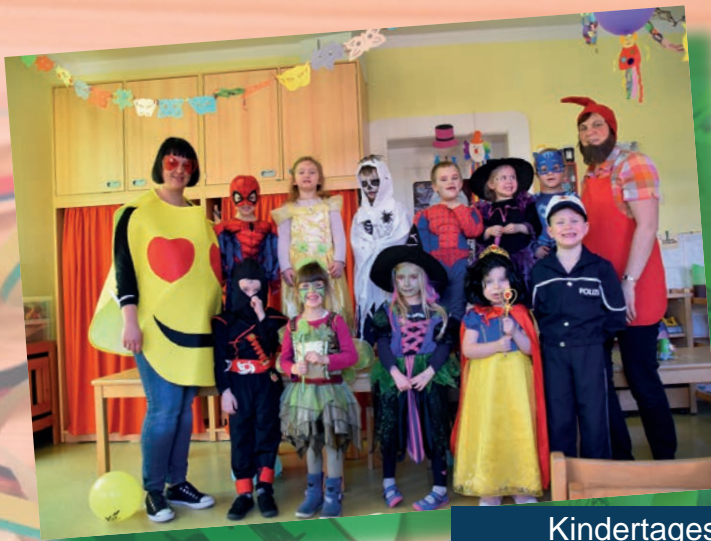
Kindertagesstätte „Villa Kunterbunt“, Treuen