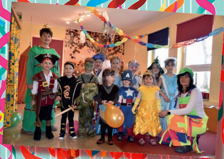
Kinderkombination „Nesthäkchen“, Treuen